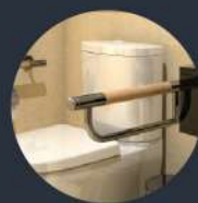
พนักแขนข้างโถ