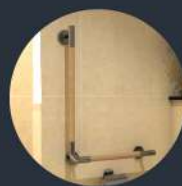
ราวจับทรงตัว