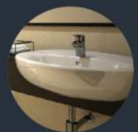
อ่างล้างหน้า ทรงมนกลม