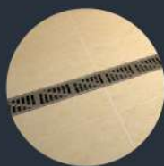
รางระบายน้ำ แบบระนาบพื้น