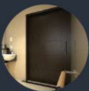
บานประตูเลื่อน แบบรางแขวน